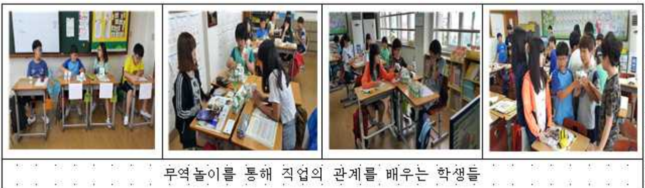
무역놀이를 통해 직업의 관계를 배우는 학생들

시장 경제의 원리를 알아보는 무역놀이(시장놀이)를 통해 다양직업을 체험해보고 우리가 물건을 사는데 많은 직업과 관련이 있음을 몸으로 체험해보고 여러 직업들의 관계를 알아보는 시간이었다.