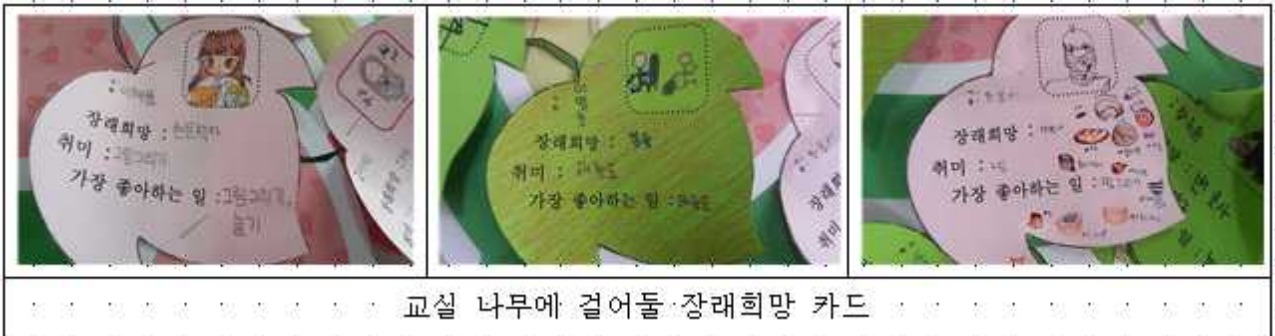
교실 나무에 걸어들·장래희망 카드

학기초 활동으로 학생들의 장래희망, 취미, 좋아하는 일 등을 카드로 작성하는 활동을 통해 직업의 세계와 자기가 잘하는 일, 좋아하는 일이 무엇인지 인지하는 활동으로 프로젝트를 준비한다. 좀 더 실제적인 활동을 위해 나를 소개하는 학습지를 통해 미리 자신의 장점과 단점을 분석하여 발표해보았다.