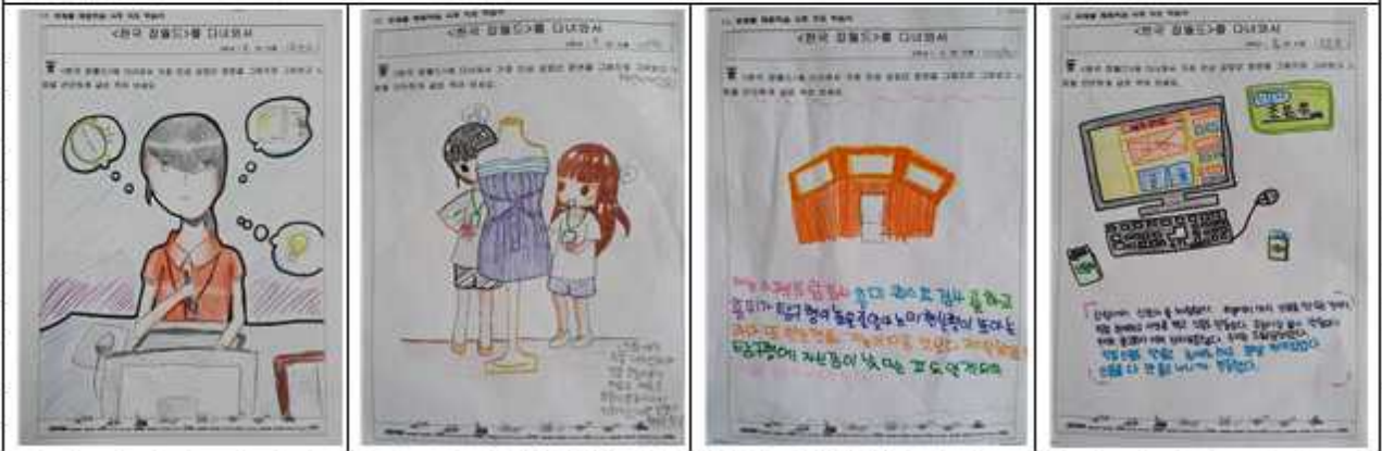
프로젝트 사후 지도 학습지