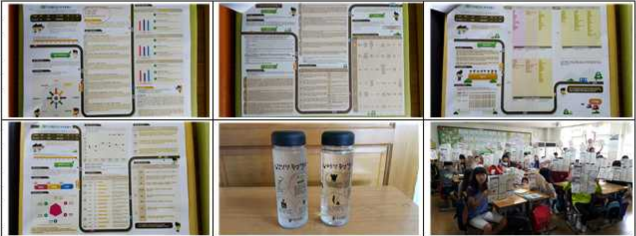
흥미검사 보고서와 재능검사 보고서

나를 찾아서! 프로젝트를 마친 소감을 함께 나누는 시간을 가진다. 한국잡월드 진로설계관에서 감사한 흥미검사 보고서와 재능검사 보고서를 함께 분석하며 나의 강점을 알아보고 내가 잘하는 것과 좋아하는 것을 알아보고 느낀점을 그림으로 표현하여 이야기 나누는 시간이었다.